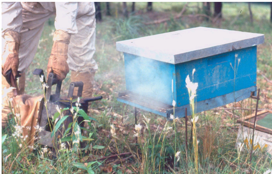
Figura 3. Apicultor aplicando fumaça no alvado com o fumegador, garantindo o manejo seguro e adequado das colméias.

Alguns apicultores substituem o formão por um facão. O mesmo acaba servindo para limpar as ervas de maior porte ao redor das colméias e os galhos pelo caminho de acesso ao apiário.