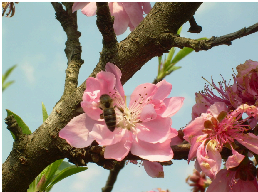
Figura 1. Durante sua visita às flores, as abelhas melíferas realizam a polinização.

Apicultura é a ciência que trata da criação e exploração racional das abelhas da espécie Apis mellifera , popularmente conhecidas como abelhas melíferas africanizadas, ou abelhas de ferrão.(Figura 1).