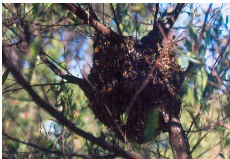
Figura 7. Enxame temporariamente pousado em galho de árvore, durante deslocamento enxameatório ou migratório.

b) colocar sobre o ninho uma melgueira vazia para que as abelhas, ao serem derrubadas para dentro do ninho, não caiam para fora pelas laterais;