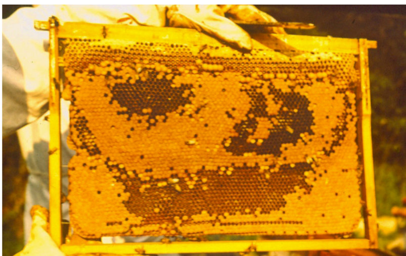
Figura 12. Favo com crias em diferentes estágios de desenvolvimento: as áreas escuras apresentam alvéolos com ovos e larvas, as áreas claras apresentam alvéolos operculados e com pupas no interior.

Preencher o restante dos espaços com quadros providos de lâminas inteiras de cera alveolada, tanto na colméia receptora quanto na doadora.