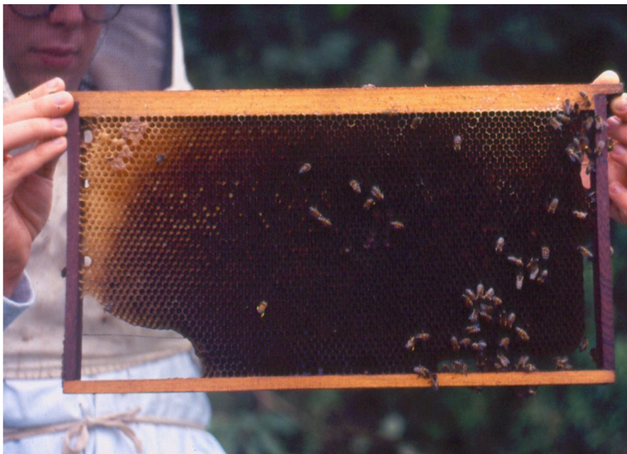
Figura 13. Favo velho, com cera escurecida e alvéolos reduzidos em diâmetro, após sucessivas gerações de cria em seu interior: deve ser substituído.

Conseqüentemente, as abelhas de ambos os enxames irão roer o papel vagorosamente. Nesse processo, os feromônios dos enxames começarão a se mesclar. As rainhas irão brigar até a morte de uma delas, passando a vitoriosa a atuar sobre as duas populações.