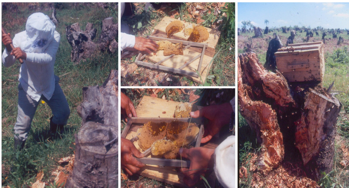
Figura 6. Remoção de enxame alojado em oco de árvore, corte e transferência dos favos para dentro de caixa com quadros, possibilitando manejos e produção de mel.

e) transferir a colméia 7 ou 10 dias mais tarde, para junto das demais num apiário a mais de 2 km, sempre no período da noite.