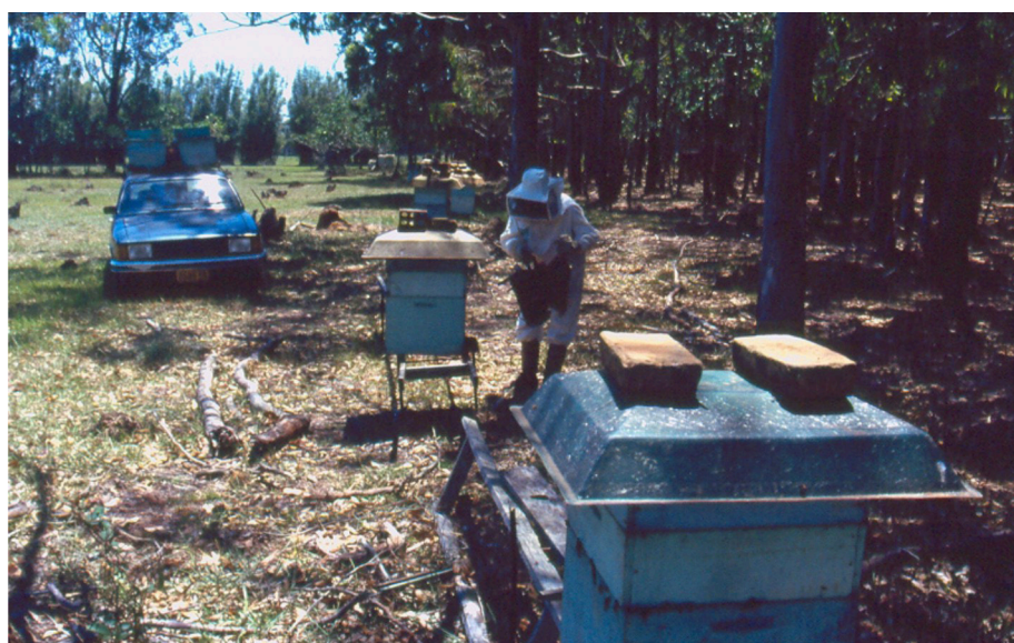
Figura 4. Apiário bem localizado e colméias instaladas individualmente sobre cavaletes.

Deve ser mantida uma distância de 1 a 3 metros entre as colméias para evitar pilhagem entre enxames. Distâncias menores confundem as abelhas campeiras e estressam as abelhas guardiãs. Distâncias maiores reduzem a eficiência e agilidade no trabalho dos apicultores (Figura 4).