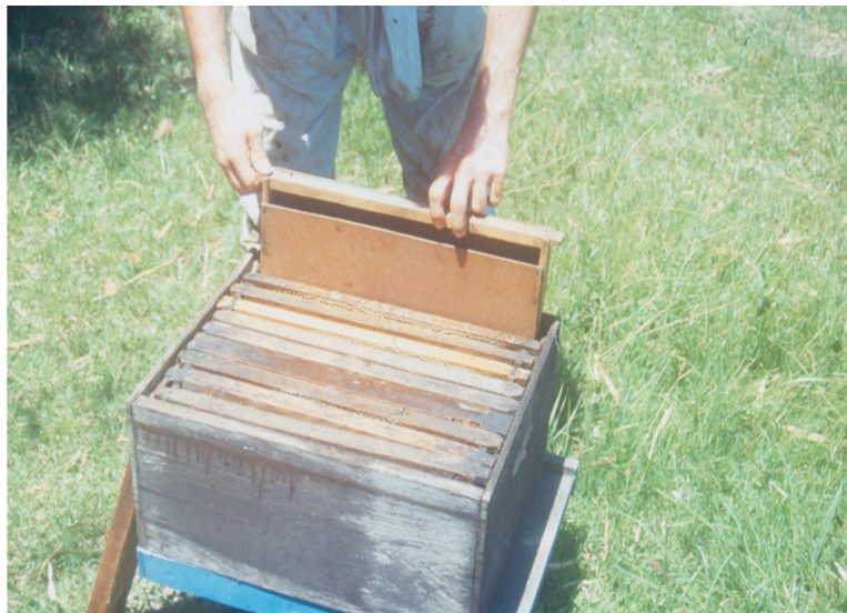
Figura 10. Alimentador tipo cocho sendo colocado na borda do ninho para acesso interno pelas abelhas durante a entressafra.

Reduzir os alvados e vedar as possíveis frestas de cada colméia. Revisar e fazer manutenção nos alimentadores (lavagem vigorosa) a cada reposição de alimento, para evitar o surgimento de fungos (mofo) e outros microorganismos. Não derramar alimentos pelo apiário, evitando pilhagem.