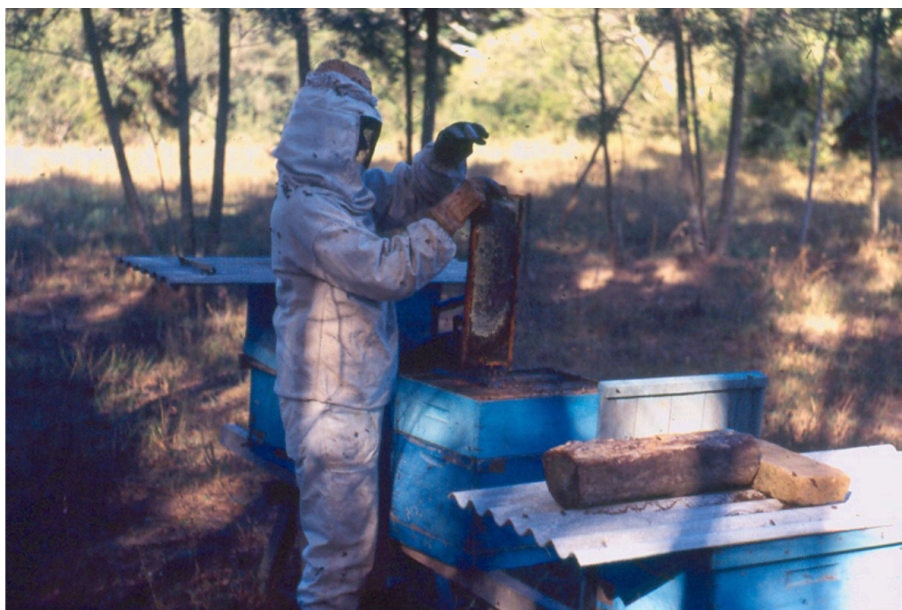
Figura 15. Durante a colheita dos favos com mel operculado, as abelhas aderentes ao mesmo são removidas de volta para a colméia.

Retire um por um os quadros da melgueira, remova as abelhas aderentes e passe imediatamente para dentro de uma melgueira vazia e tampada (melgueira de transporte). A melgueira que estava na colméia e ficou vazia, poderá ser removida e usada para receber os quadros da próxima colméia do apiário, ou poderá ficar no lugar e ser preenchida por outros caixilhos de melgueira com favos vazios ou lâminas inteiras de cera alveolada.