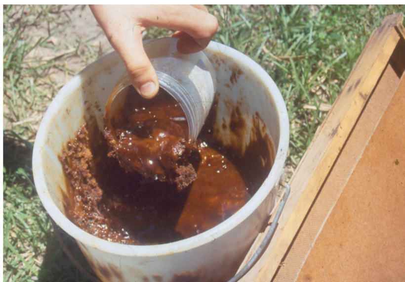
Figura 9. Alimentação artificial na forma pastosa: abastecendo alimentador tipo cocho.

Quando se pretende caracterizar o mel produzido nos apiários como oriundo de produção orgânica, nas alimentações artificiais os apicultores deverão usar exclusivamente mel próprio, açúcar mascavo ou mesmo branco, desde que de origem orgânica. Conservantes sintéticos são condenados na criação ecológica de abelhas e produção de mel orgânico.