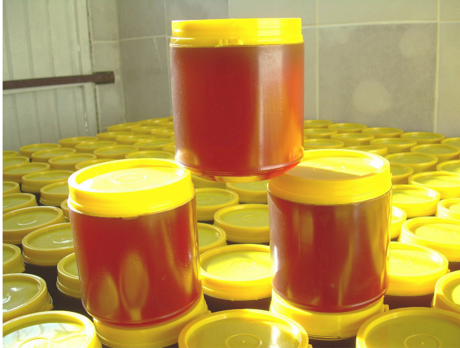
Figura 17. Mel processado e embalado para comercialização direta ao consumidor.