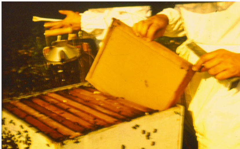
Figura 11. Limpeza do ninho e troca de quadros com favo velho por quadros com lâminas inteiras de cera alveolada.

para depósito de mel, com o acréscimo de melgueiras.