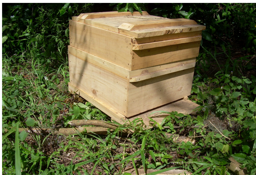
Figura 2. colméia Langstroth padrão, com fundo, ninho, melgueira e tampa.

O modelo de colméia mais utilizado no Brasil é o Langstroth (caixa "americana") (Figura 2) que, pela padronização, além de favorecer a troca de materiais e de relatos sobre as práticas e procedimentos entre os apicultores, facilita o próprio manejo das colméias pelos apicultores, em função das dimensões dos quadros e peças da caixa e de certos detalhes construtivos da mesma (Quadro 1).