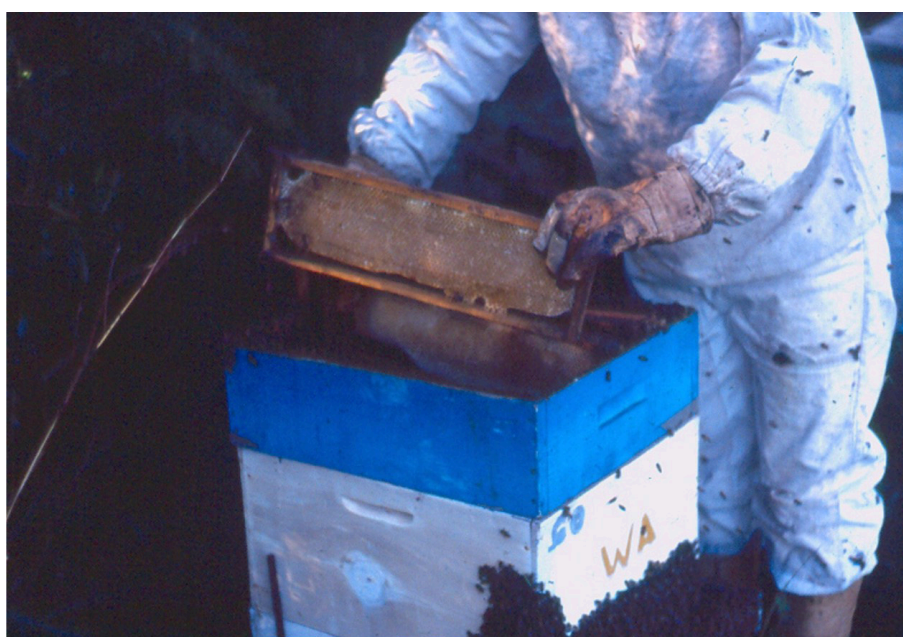
Figura 14. o momento da colocação da primeira melgueira é o mais crítico e exige um bom preparo inicial da colônia pelos apicultores.