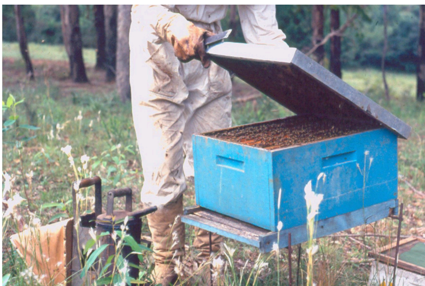
Figura 8. Revisão e limpeza de colméias no início da safra: procedimento fundamental para garantir boa colheita.

Planejar o trabalho antes de ir a campo. Conferir se todo o material está indo para o apiário. Identificar suas colméias e usar fichas ou caderneta de controle.